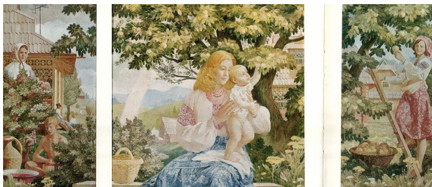
Мал. 3. Микола Варення, триптих «Літо». Полотно, олія. 1979.

Щодо впливу та ролі мистецтва України XIX-XX ст. зазначимо, що творчі пошуки українських художників мали багато напрямів (наприклад, реалізм М. Варення та класицизм родини Басанець, П.О. Басанець 1926–2007, Ю.П. Басанець, О.П. Басанець). Найпопулярнішим способом творчості художників сучасності стає абстракціонізм . Головною ознакою сучасного українського мистецтва є поєднання абстрактного та фігуративного методів. Приклади – творчість таких художників як В. Іванов, А. Блудов, А. Владимиров та ін.