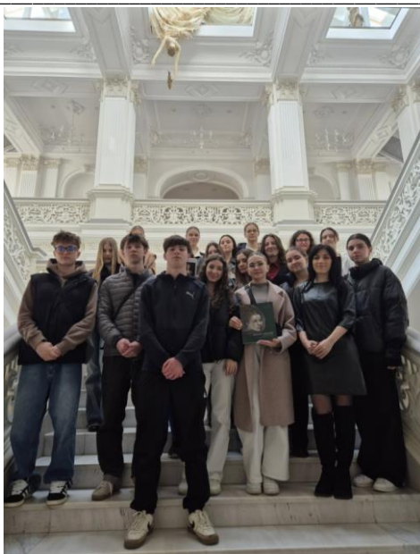
Мал. 7. Реалізація практичних занять з учнівською молоддю Коледжу Міжнародного Незалежного Університету Молдови, 2024. Педагог з Історії мистецтва: Ю.Герман