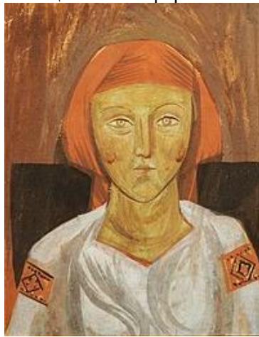
Мал. 2. Михайло Бойчук, Українка . 1910.

Бойчукізм – це культурно-мистецьке явище в історії українського мистецтва 1910-1930-х років, яке вирізняється художнім монументально-синтетичним стилем. Основою концепції бойчуківського розвитку нового мистецтва стало звернення до традицій візантійського та італійського монументального живопису, а також давньоруського іконопису як першоджерела української національної форми.