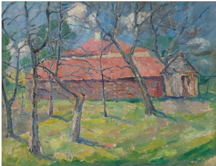
Мал. 1. Малевич Казимир, Пейзаж під Києвом . 1930.

У XVIII ст. Російська імперія знищила осередки, які готували майстрів (художників) Наддніпрянщини. Поступово було ліквідовано цілі художні класи при Харківському колеґіумі, художню школу при Києво-Печерському монастирі було зведено до рівня майстерні іконописного ремесла. З цієї причини українське мистецтво, яке раніше не поступалося кращим європейським зразкам, занепало (Калініченко, Уманцев 1960). Початок мистецтва класицизму пов'язаний із творчістю двох відомих авторів українського походження – майстра інтимного портрету Дмитра Левицького (1735, Київ – 1822, Санкт-Петербург) та майстра портретного живопису Володимира Боровиковського (1757, Миргород, Гетьманщина – 1825, Санкт-Петербург). Казимир Северинович Малевич (1879, Київ – 1935, Санкт-Петербург) – відомий усьому світу творець супрематизму, з українським корінням. Творчість Казимира Малевича різноманітна з точки зору вибору жанру та технік виконання – «Автопортрет» (1910, приватна колекція), «Голова селянина» (1929), «Пейзаж під Києвом» (1930) та ін.